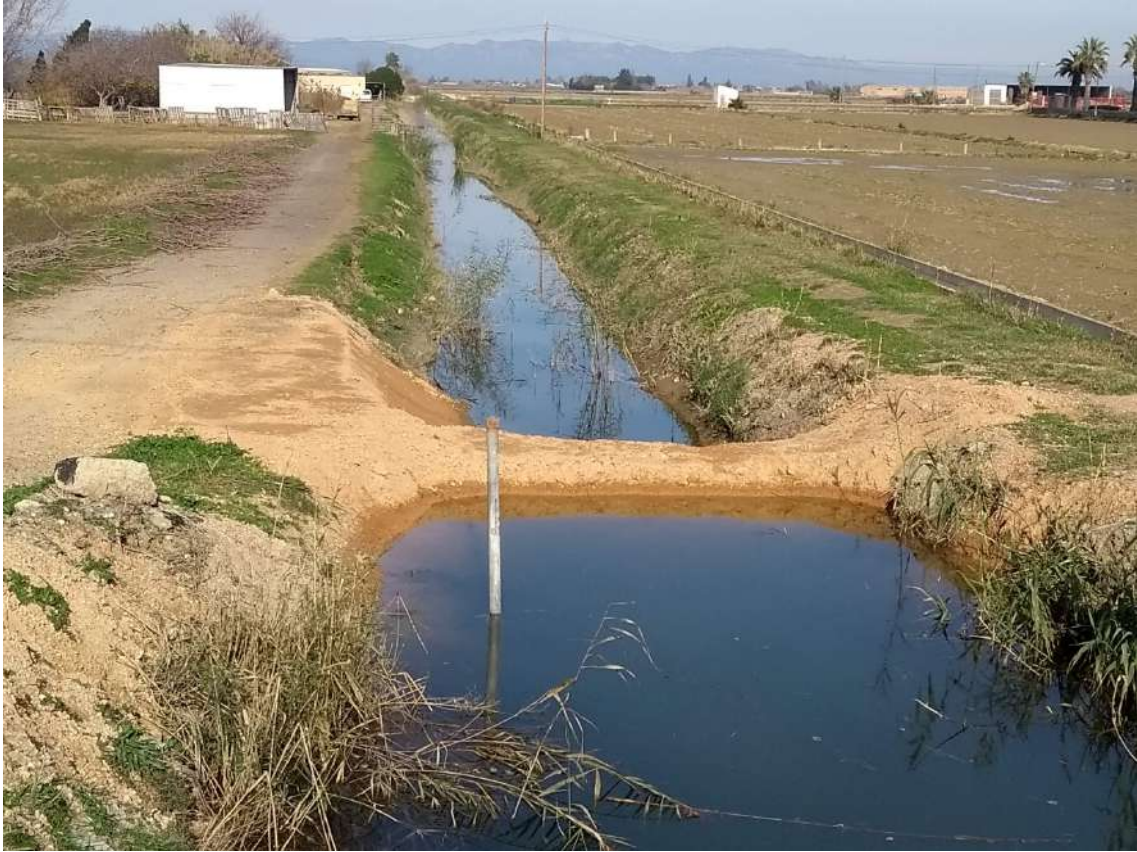
ATALL BUFONA AL LÍMIT DESPRÉS DE PLUGES