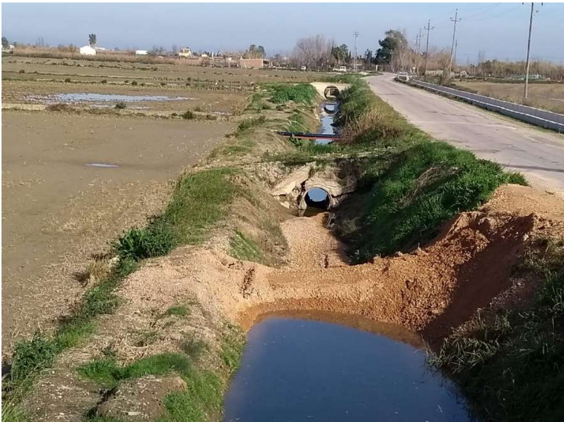
ATALL LLEBRET AL LÍMIT DESPRÉS DE PLUGES