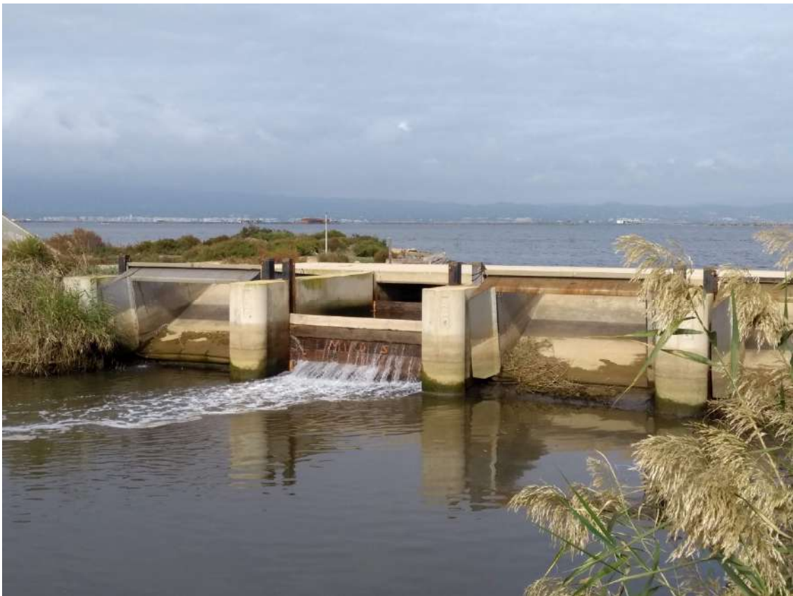
SOLTADA ROMPENT – IMATGE DE LA TAULONADA