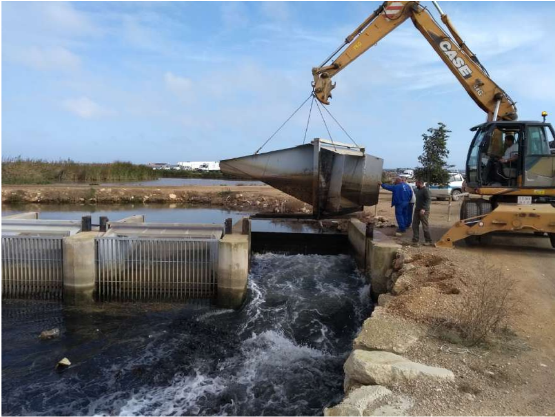
SOLTADA AIGUA ILLA DE MAR - RETIRADA COMPORTA BASCULANT