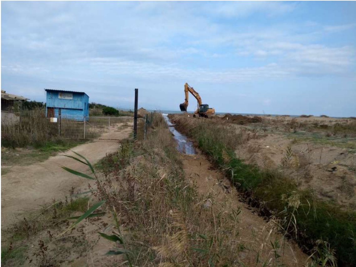
APERTURA DESGUÀ NOU PUNT SOLTADA AIGUA SALADA A BASSA DE L'ARENA