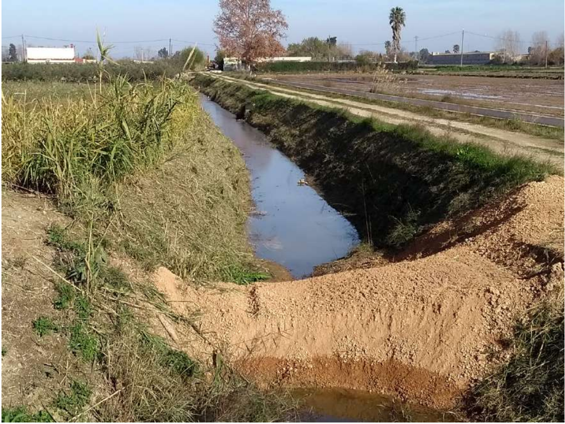
ATALL TARUGO AL LÍMIT DESPRÉS PLUGES