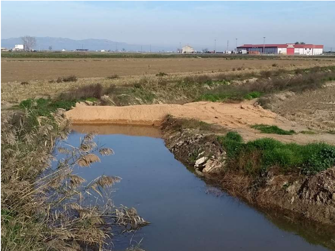
ATALL MAQUITOS AL LÍMIT DESPRÉS DE PLUGES