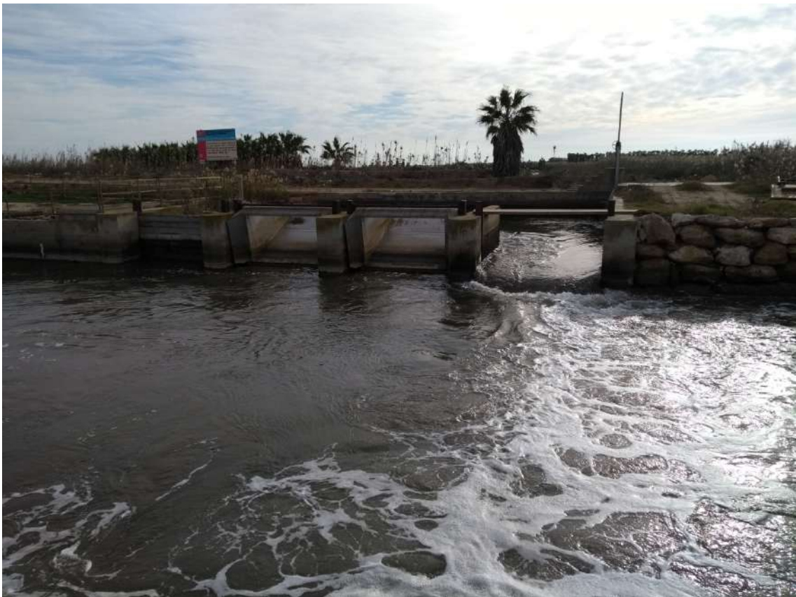
ENTRADA AIGUA SALADA PER PAL